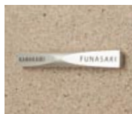
NS-SA02 M6352 ￥56,000(別途送料) φ35×290mm 本体:アルミφ35 納期:実働10日 使用書体:ME-66