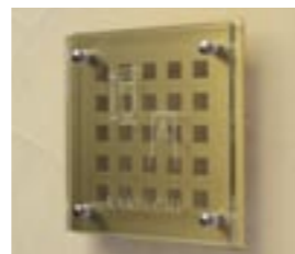
NS-SGB01 M6342 ￥47,000(別途送料) 208×208×60mm 本体:単板ガラス+真鍮 納期:実働7日 使用書体(文字色):MW-12(文字色なし) / ME-62(文字色なし) ※真鍮は表面をクリア塗装処理しておりますが、酸化により錆が出てくる事があります。風合いとしてお楽しみ下さい。