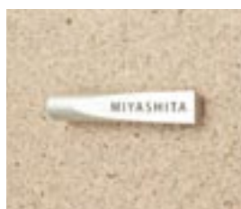
NS-SA01 M6351 ￥52,000(別途送料) φ35×200mm 本体:アルミφ35 納期:実働10日 使用書体:ME-66

※材質:アルミ・ステンレス ※商品の仕様上、特注品を製作する事ができません。 ※フォントの変更・色変更などできません。