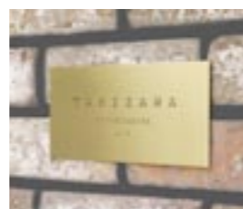
NS-SB01 M6355 ￥36,000(別途送料) 210×100×3mm 本体:真鍮 t=3mm 納期:実働10日 使用書体:ME-63