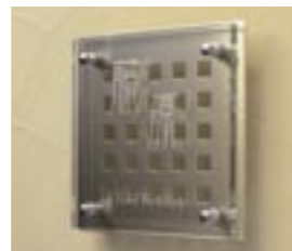
NS-SGS01 M6345 ￥40,000(別途送料) 208×208×60mm 本体:単板ガラス+ステンレス 納期:実働7日 使用書体(文字色):MW-12(文字色なし) / ME-62(文字色なし)