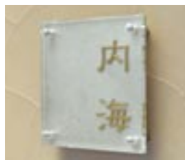
MA-TGS-01 M6347 ￥43,500(別途送料) 200×200×50mm 本体:単板ガラス+ステンレス 納期:実働12日 使用書体(文字色):和-5(金・裏彫り)

※材質:ステンレス・アルミ・アルミ鋳物・真鍮・ガラス ※文字色はP8の「カラーバリエーション」からお選び頂けます。