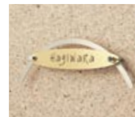
NS-SSB02 M6362 ￥47,000(別途送料) 280×90×38mm 本体:真鍮 t=2mm 装飾:ステンレス t=2mm 納期:実働9日 使用書体:ME-65