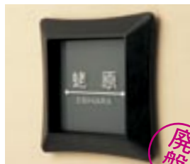
NS-SGI01 (AS) M6343 ￥— 200×200×37mm 本体:ガラス+アルミ鋳物 使用書体(文字色):MW-2(白) / ME-60(白)