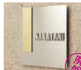
NS-SSB01 M6361 ￥— 200×200×5mm 本体:ステンレス t=2mm 装飾:真鍮 t=3mm 文字:ステンレス t=3mm 使用書体:ME-48

※材質:ステンレス・真鍮・ガラス ※商品の仕様上、特注品を製作する事ができません。 ※フォントの変更・色変更などできません。