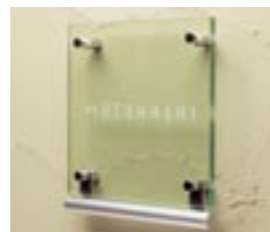
NS-SGA01 M6341 ￥51,000(別途送料) 200×220×43 本体:単板ガラス+アルミ 納期:実働7日 使用書体(文字色):ME-12(文字色なし)