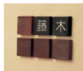
NS-CA01(ピース6個組み、名入り2個+4個) M6371 ￥32,000(別途送料) 60×60×15mm 納期:実働5日 使用書体:MW-2

※材質:陶器 ※商品の仕様上、特注品を製作する事ができません。 ※フォントの変更・色変更などできません。 ※窯元職人による手焼き製品です。サイズ・色調・模様が一点一点異なります。風合いとしてお楽しみ下さい。