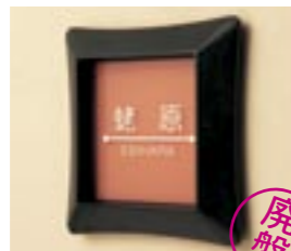
NS-SGI01 (OR) M6344 ￥— 200×200×37mm 本体:ガラス+アルミ鋳物 使用書体(文字色):MW-2(白) / ME-60(白)