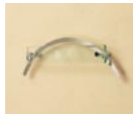
NS-SGS02 M6346 ￥40,000(別途送料) 280×90×43mm 本体:単板ガラス+ステンレス 納期:実働7日 使用書体(文字色):MW-17(白)