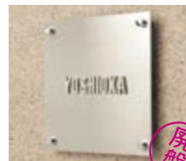
NS-SS03 M6358 ￥— 200×200×30mm 本体:ステンレス t=2mm 文字:ステンレス t=3mm 使用書体:ME-48

※材質:ステンレス ※商品の仕様上、特注品を製作する事ができません。 ※フォントの変更・色変更などできません。