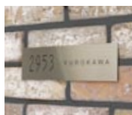
NS-SS02 M6357 ￥31,000(別途送料) 250×70×2mm 本体:ステンレス t=2mm 納期:実働9日 使用書体:ME-14