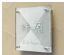
MA-TGS-02 M6348 ￥43,500(別途送料) 200×200×50mm 本体:単板ガラス+ステンレス 納期:実働12日 使用書体(文字色):和-2(銀・裏彫り) / 和-2(銀・裏彫り)