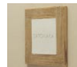
NS-CA03 M6377 ￥25,000(別途送料) 200×200×12mm 納期:実働5日 使用書体:ME-8