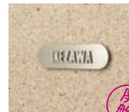
NS-SS04 M6359 ￥— 185×50×12mm 本体:ステンレス t=3mm 文字:ステンレス t=3mm 使用書体:ME-48