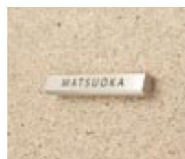
NS-SA03 M6353 ￥47,000(別途送料) φ35×200mm 本体:アルミφ35 文字部分:ステンレス t=3mm 納期:実働10日 使用書体:ME-66