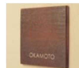
NS-CA02 M6375 ￥25,000(別途送料) 200×200×12mm 納期:実働5日 使用書体:ME-8