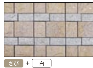
さび + 白