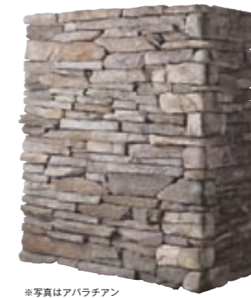
レッジストーン (最大厚70mm) 納期:実働2日

フラット ¥23,800/BOX(1.2㎡入り) (別途送料) イングリッシュ M9605 コーナー ¥8,800/m(別途送料) イングリッシュ M9625