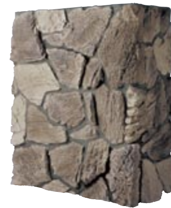
ドリフトストーン (最大厚80mm) 納期:実働2日