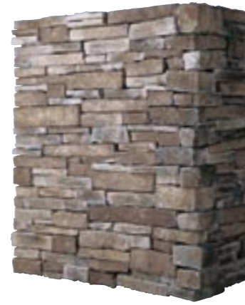
スタック (最大厚60mm) 納期:実働2日

フラット ¥19,800/BOX(1.0㎡入り) (別途送料) アリゾナ M9608 コーナー ¥8,800/m(別途送料) アリゾナ M9628