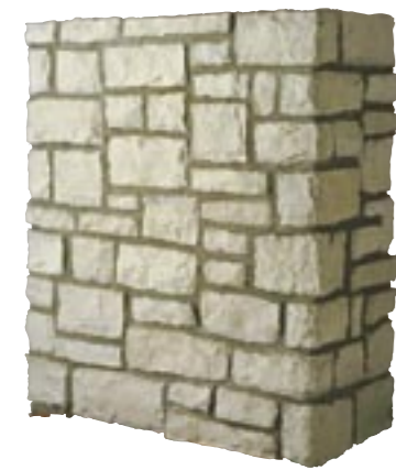
ラップル (最大厚50mm) 納期:実働2日

フラット ¥21,800/BOX(1.1㎡入り) (別途送料) グレー M9612 コーナー ¥8,800/m(別途送料) グレー M9632