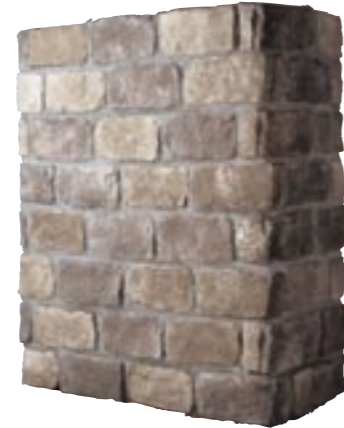
コップルストーン (最大厚45mm) 納期:実働2日

フラット ¥19,800/BOX(1.0㎡入り) (別途送料) カリフォルニア M9604 コーナー ¥8,800/m(別途送料) カリフォルニア M9624