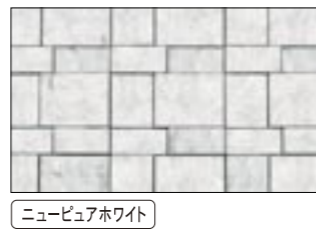
ニュービュアホワイト