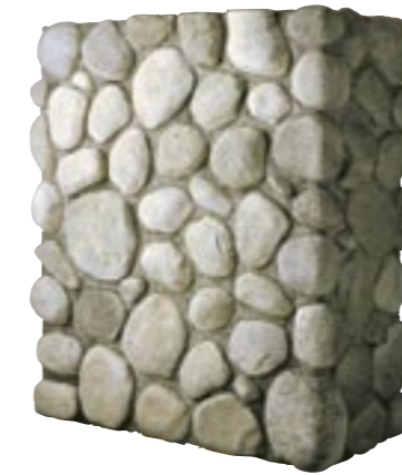
リバーロック (最大厚70mm) 納期:実働2日

フラット ¥25,800/BOX(1.3㎡入り) (別途送料) ブロード M9607 コーナー ¥8,800/m(別途送料) ブロード M9627