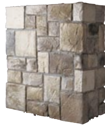
センチュリオンキャッスル (最大厚35mm) 納期:実働2日