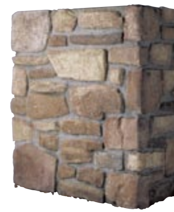
フィールドストーン (最大厚60mm) 納期:実働2日