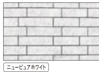
ニュービュアホワイト