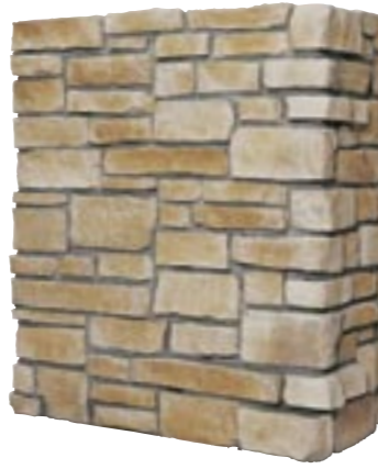
ウェザーエッジ (最大厚60mm) 納期:実働2日

フラット ¥25,800/BOX(1.3㎡入り) (別途送料) オハイオ M9606 コーナー ¥8,800/m(別途送料) オハイオ M9626