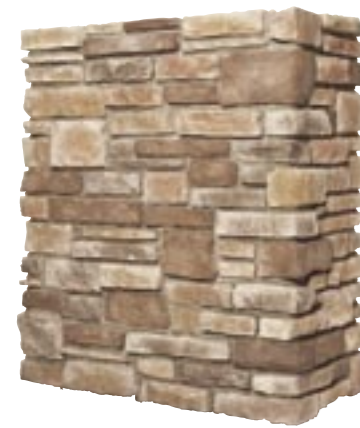
カットフェイス (最大厚60mm) 納期:実働2日

ニューキャップストーン 457×280×25mm ¥3,300/枚(別途送料) 納期:実働2日