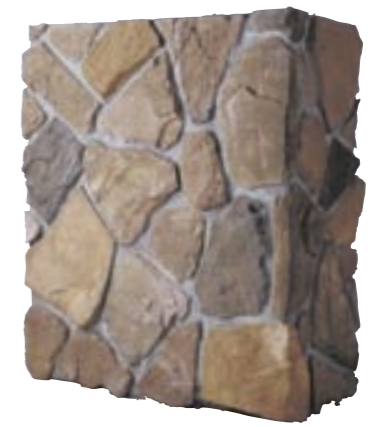
バロスパーデ (最大厚50mm) 納期:実働2日