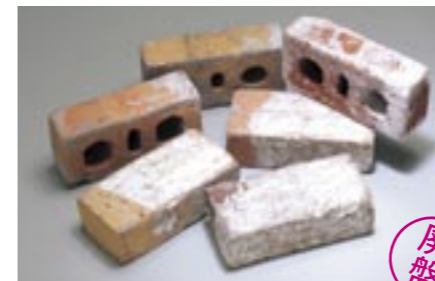
すじ雲【基本】 M3201 ¥— /個 215×65×102.5mm

※使用数量：積みの場合59.3個/m 2 (基本)、敷きの場合45.4個/m 2 (笠木)