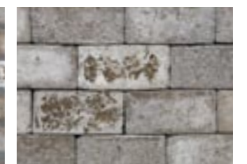
シュガーブラウン【笠木】 M3238 ¥480/個 215×65×102.5mm