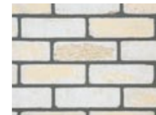
シュガーホワイト【基本】 M3231 ¥430/個 215×65×102.5mm