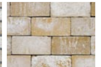
シュガーイエロー【笠木】 M3234 ¥480/個 215×65×102.5mm