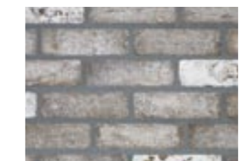
シュガーブラウン【基本】 M3237 ¥430/個 215×65×102.5mm