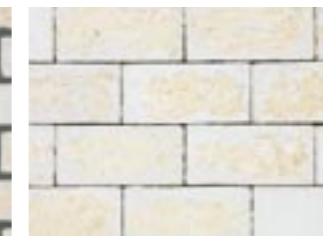
シュガーホワイト【笠木】 M3232 ¥480/個 215×65×102.5mm