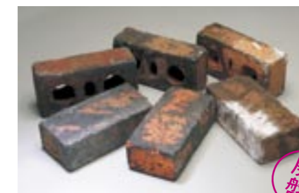
霧雲【基本】 M3207 ¥— /個 215×65×102.5mm