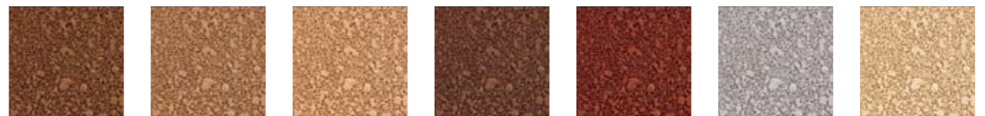
サンドストーン N M5651 ¥10,400 約9.3m 2 /袋 デザートサンド N M5652 ¥10,400 約9.3m 2 /袋 ピーチ N M5653 ¥10,400 約9.3m 2 /袋 オータムブラウン N M5654 ¥10,400 約9.3m 2 /袋 テラコッタ N M5655 ¥10,400 約9.3m 2 /袋 セイブル N M5657 ¥10,400 約9.3m 2 /袋 カメオ N M5658 ¥10,400 約9.3m 2 /袋