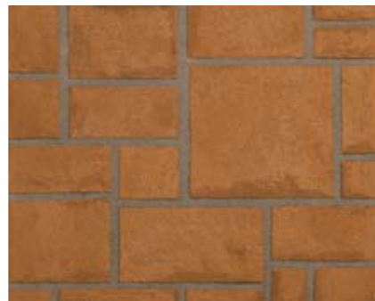
アシュラスレイトN 小ロール M5613N1 ¥15,000/約9.3m 2 ベースカラー例:サンドストーンN