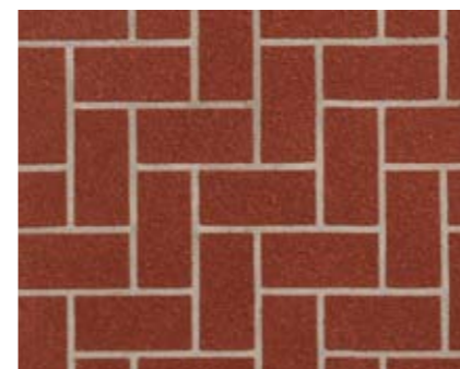
ヘリンボーンN 小ロール M5614N1 ¥15,000/約9.3m 2 ベースカラー例:テラコッタN