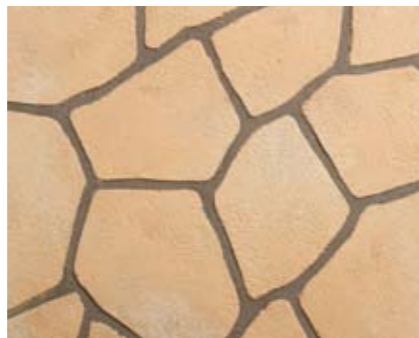
フラッグストーンN 小ロール M5612N1 ¥15,000/約9.3m 2 ベースカラー例:ピーチN アクセントカラー例:カメオN