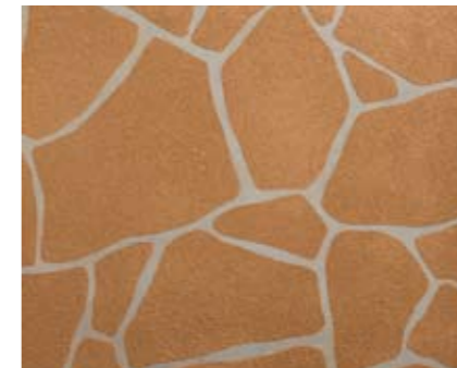
ランダムストーンN 小ロール M5618N1 ¥15,000/約9.3m 2 ベースカラー例:デザートサンドN