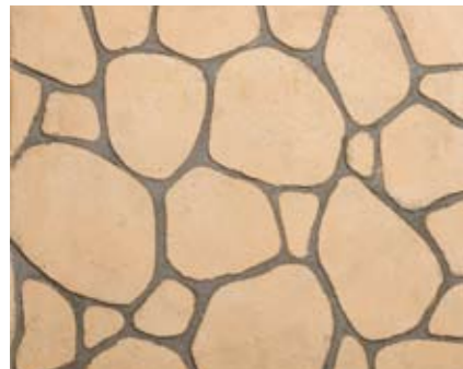
ボルダーN 小ロール M5617N1 ¥15,000/約9.3m 2 ベースカラー例:ピーチN