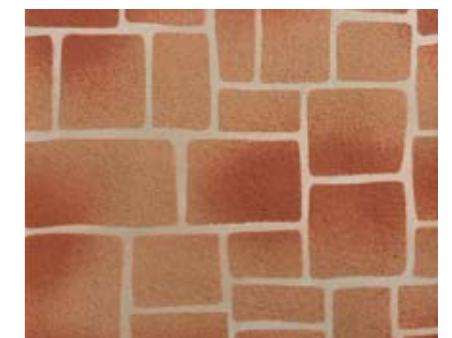
コブルストーンN 小ロール M5616N1 ¥15,000/約9.3m 2 ベースカラー例:デザートサンドN アクセントカラー例:テラコッタN