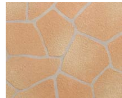
フラッグストーンN 小ロール M5612N1 ¥15,000/約9.3m 2 ベースカラー例:ピーチN アクセントカラー例:カメオN