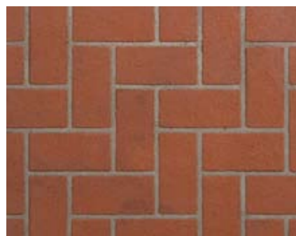
ヘリンボーンN 小ロール M5614N1 ¥15,000/約9.3m 2 ベースカラー例:テラコッタN