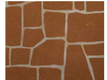
テッペイン 小ロール M5619N1 ¥15,000/約9.3m 2 ベースカラー例:サンドストーンN