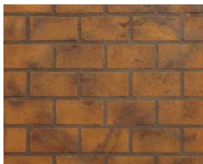
ランニングボンドN 小ロール M5615N1 ¥15,000/約9.3m 2 ベースカラー例:サンドストーンN アクセントカラー例:オータムブラウンN