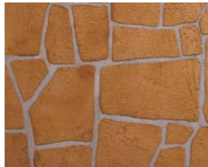
テッペイン 小ロール M5619N1 ¥15,000/約9.3m 2 ベースカラー例:サンドストーンN