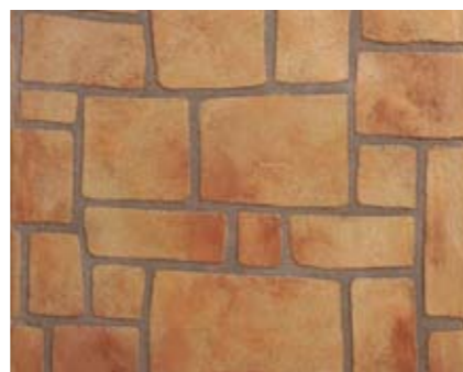
コブルストーンN 小ロール M5616N1 ¥15,000/約9.3m 2 ベースカラー例:デザートサンドN アクセントカラー例:テラコッタN