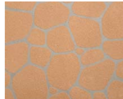
ボルダーN 小ロール M5617N1 ¥15,000/約9.3m 2 ベースカラー例:ピーチN