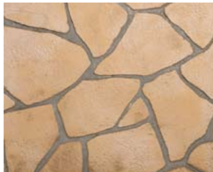
ランダムストーンN 小ロール M5618N1 ¥15,000/約9.3m 2 ベースカラー例:デザートサンドN