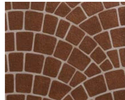
フィッシュスケールN 小ロール M5611N1 ¥15,000/約9.3m 2 ベースカラー例:オータムブラウンN