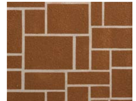
アシュラスレイトN 小ロール M5613N1 ¥15,000/約9.3m 2 ベースカラー例:サンドストーンN